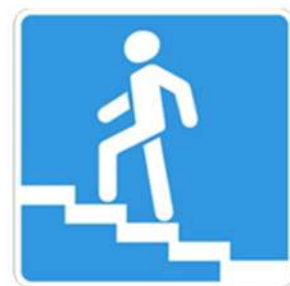
Надземный пешеходный переход