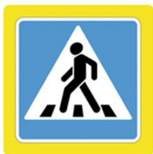
Наземный пешеходный переход