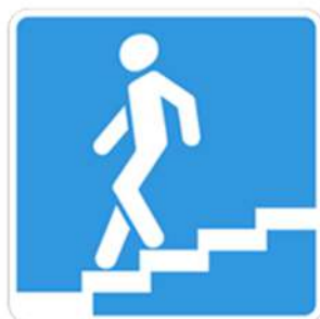
Подземный пешеходный переход